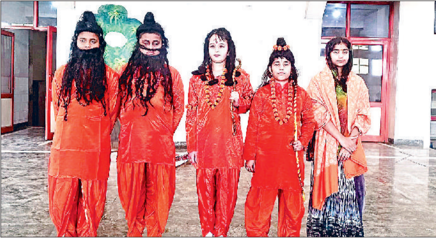
रोहतक। कार्यक्रम में प्रस्तुती देते छात्र।