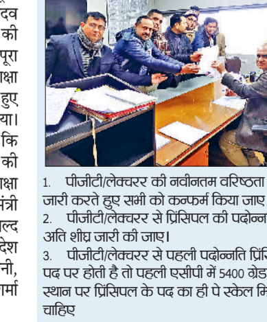
1. पीजीटी/लेक्चरर की नवीनतम वरिष्ठता सूची जारी करते हुए सभी को कम्प्लेंट किया जाए। 2. पीजीटी/लेक्चरर से प्रिंसिपल की पदोन्नति सूची अति शीघ्र जारी की जाए। 3. पीजीटी/लेक्चरर से पहली पदोन्नति प्रिंसिपल के पद पर होती है तो पहली एसीपी में 5400 वेतन के स्थान पर प्रिंसिपल के पद का ही वेतन मिलना चाहिए