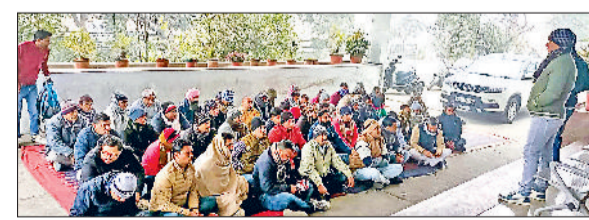
धरनार्थियों को संबोधित करते वक्ता।