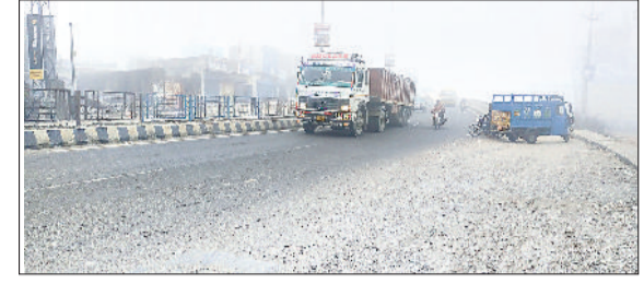
कुरुक्षेत्र। सुबह आसमान में छाई धुंध व अपने गंतव्य की ओर जाते वाहन चालक ।

जिला में मंगलवार को भी ठंड का सितम जारी रहा। शीतलहर के कारण हर कोई ठंड से बचने के उपाय ढूंढता दिखाई दिया। ठंड से बचने के लिए ज्यादातर दुकानदारों ने अलावा जलाया। शीतलहर बेजुबान पशुओं पर भी भारी पड़ रही है। सड़कों बेजुबान पशुओं पर धूम रहे पर भी भारी गोवंश के लिए पड़ रही यह ठंड खतरा साबित हो