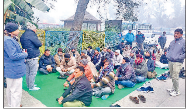
कुरुक्षेत्र। रोडवेज कर्मियों को संबोधित करते यूनियन नेता।