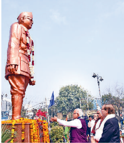
रोहतक। नेताजी सुभाषचंद्र बोस की मूर्ति पर पुष्प अर्पित करते उन्हें श्रद्धांजलि देते मुख्यमंत्री मनोहर लाल।