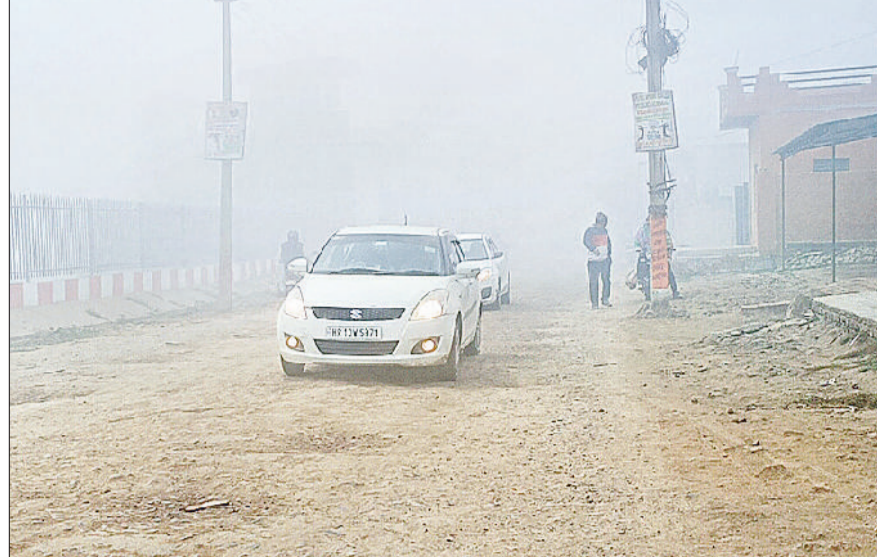
यमुनानगर। मंगलवार को घने कोहरे में सड़कों पर लाइटें जलाकर गंतव्य पर पहुंचते वाहन ।

मंगलवार को तड़के तीन बजे से ही जिले में शीतलहर और घना कोहरा का प्रकोप बढ़ने लगा था। आलम यह था कि सड़कों पर सुबह दस बजे तक घना कोहरा छाया रहा। जिसमें लोगों को चार फुट की दूरी पर भी वाहन व अन्य कोई वस्तु दिखाई नहीं दी। वाहन चालक लाइटें जलाकर सड़कों से गुजरने पर मजबूर थे। सुबह करीब ग्यारह बजे के बाद घना कोहरा तो कम हो गया। मगर दिन भर आसमान में धुंध के बादल छाए रहे और