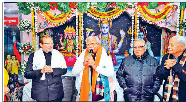
इससे पूर्व मुख्यमंत्री ने स्थानीय मॉडल टाऊन स्थित गुफा वाला मंदिर में मत्था टेका। उन्होंने मंदिर में सभी प्रदेशवासियों के लिए मंगल कामना की। इसके उपरांत उन्होंने स्थानीय सुभाष चौक पर स्थित नेताजी सुभाष चंद्र बोस की प्रतिमा पर पुष्प अर्पित कर श्रद्धांजलि दी।